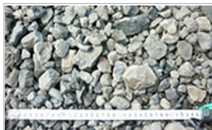
⑦ エコラロック (徐冷エコスラグ) ・路盤材、舗装材、護岸材などとしてリサイクルします。