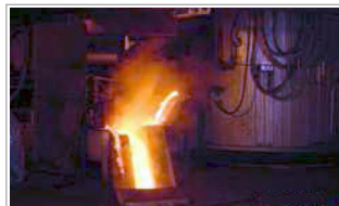
④ メタル 鑄銑