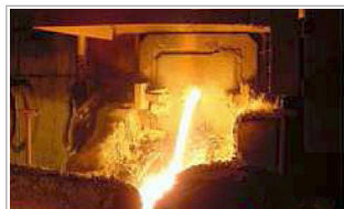
⑥ スラグ 排出