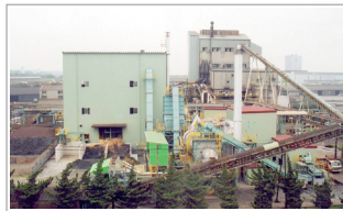
焼却灰溶融専用炉全景