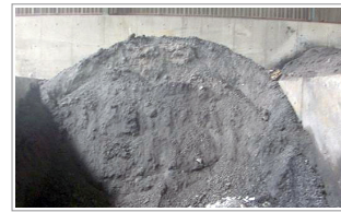
廃棄物(一般・産業廃棄物)