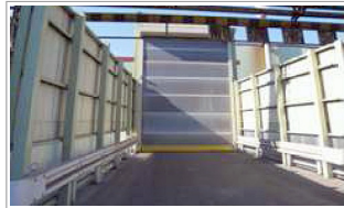
① 二重開閉式投入ホッパー