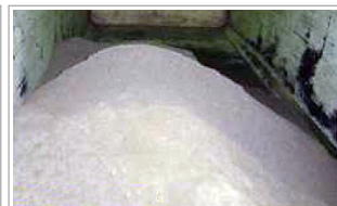
溶融飛灰 ・亜鉛、鉛、カドミウムなどをリサイクルします。