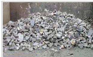
⑤ 溶融メタル ・金、銀、銅などをリサイクルします。